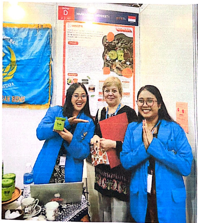
(Bersama Salah Satu Juri)