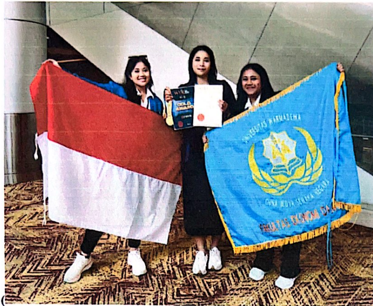
(Bersama Ibu Pendamping A.A Istri Gangga Dewi., S.Kom.,M.Kom)